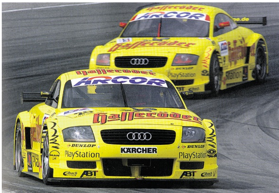
Auf „Probefahrt“: Der Abt-Audi TT litt nach extrem kurzer Entwicklungsphase in der DTM-Saison 2000 unter Kinderkrankheiten. 2002 holte er den Titel.